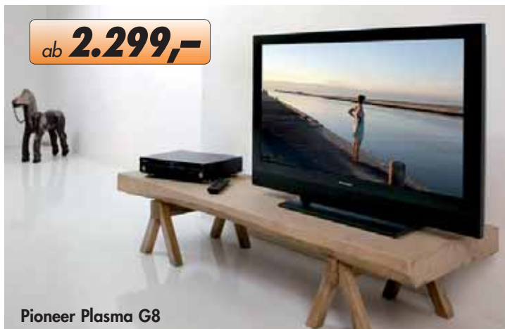
Pioneer Plasma G8

Die neuesten Home Cinema Projektoren, LCD- und Plasma-Fernsehgeräte liefern bereits „echte“ 1080i HDTV-Auflösung. HDTV gilt als der ultimative Weg zu technisch hervorragenden TV-Bildern in bester Qualität, Farbtiefe und Detailschärfe. HDTV ist der Standard der Zukunft.