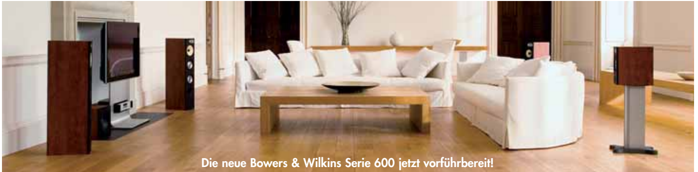
Die neue Bowers & Wilkins Serie 600 jetzt vorführbereit!

Das 1966 von John Bowers in Worthing gegründete Unternehmen Bowers & Wilkins fertigt hochwertige und vielfach ausgezeichnete Lautsprecher. Bowers & Wilkins genießt einen weltweiten Ruf für seine Innovationen im Audio-Bereich und in seinem Streben nach dem perfekten Lautsprecher setzte es als erstes Unternehmen Kevlar® und Diamanten ein.