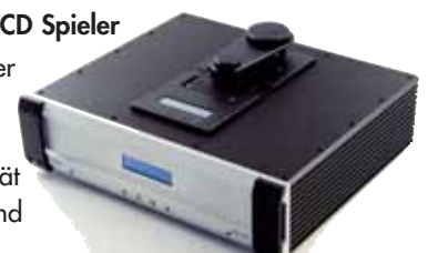
A 1008 CD Spieler

Die A 1008 Serie bietet Ihnen außergewöhnliche Musikalität, hochwertiges Design und beste Verarbeitung.