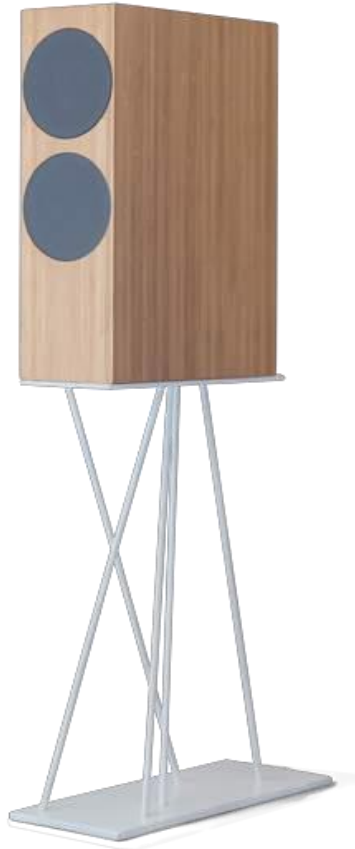
Forest 40 new