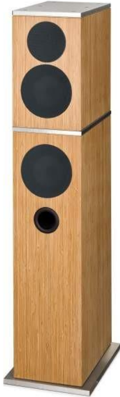
Model 202 Aluminium

Aluminium und Bambus, eine Kombination die Eleganz und exzellenten Klang vereint.