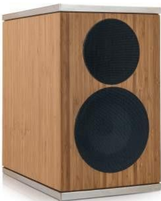
Model 201 Aluminium

Zwei-Wege-Bassreflex-System. Bändchen Hochtöner, Magnesium Tieftöner mit Kupfer Phase-Plug.